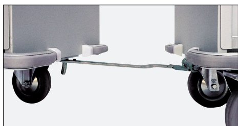
Paraurti inferiori a tutto tondo, struttura di aggancio dedicata per un traino sicuro