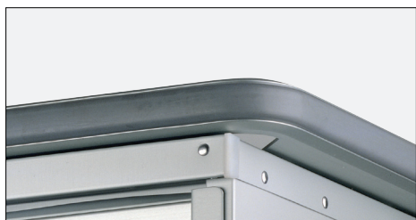
Paraurti superiori a tutto tondo per il trasporto all'interno dei camion

Carrelli rigidi in alluminio per il trasporto di apparecchiature mediche sterili e non tra campus o tra sterilizzazione centrale e reparti riceventi.